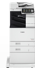
iR ADV DX C478