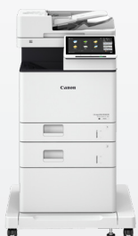
iR ADV DX 717/617/527